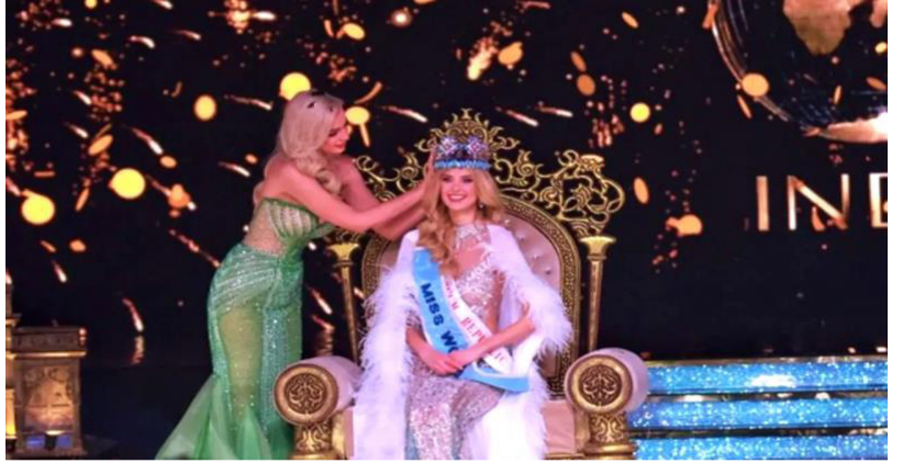
ചെക്ക് റിപ്പബ്ലിക്ക് നിന്നുള്ള ക്രിസ്റ്റിന പിസ്കോവ മിസ് വേൾഡ് 2024 കിരീടം നേടി

മാർട്ടിൻ സ്കോർസെ സിയിലെ മോളി ബർഖാർട്ടിന്റെ വേഷത്തിന് മികച്ച നടിയായി നാമനിർദ്ദേശം ചെയ്യപ്പെട്ട ആദ്യത്തെ സ്വദേശി ലില്ലി ഗ്ലാഡ്സ്റ്റോണിനെ പിന്തള്ളി എമ്മ സ്റ്റോൺ, പാവങ്ങൾ എന്ന ചിത്രത്തിലെ അഭിനയത്തിന് മികച്ച നടിയായി തിരഞ്ഞെടുക്കപ്പെട്ടു. പുഷ്പ ചന്ദ്രന്റെ കൊലയാളികൾ. ഈ വർഷത്തെ ചടങ്ങ് ലോസ് ഏഞ്ചൽസിലെ ഡോൾബി തിയേറ്ററിൽ നടന്നു, ഒന്നിമിഷങ്ങളുടെ പങ്ക് അവതരിപ്പിച്ചു.