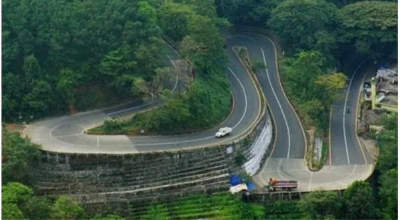
വയനാട് ചുരത്തിന്റെ (ഫയൽ ചിത്രം)