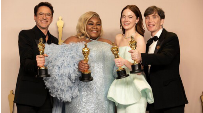
ഓസ്കാർ ഷോയിൽ പാവങ്ങൾ എന്ന ചിത്രത്തിലെ അഭിനയത്തിന് എമ്മ സ്റ്റോൺ മികച്ച നടിക്കുള്ള ഓസ്കാറും സിലിയൻ മർഫി ഓപ്പൺഹൈമർ എന്ന ചിത്രത്തിന് മികച്ച നടനുള്ള ഓസ്കാർ നേടി.

യു.സ്.എ:ക്രിസ്റ്റഫർ നോളന്റെ ഓപ്പൺഹൈമർ, ആറ്റോമിക് യുഗത്തിന്റെ ഉദയത്തിന്റെ അന്ധാസ്മയകരമായ കാഴ്ച, ഞായറാഴ്ച നടന്ന 96ാമത് അക്കാദമി അവാർഡിൽ ആധിപത്യം സ്ഥാപിച്ചു, മികച്ച ചിത്രവും മികച്ച സംവിധായകനും ഉൾപ്പെടെ ഏഴ് സമ്മാനങ്ങൾ നേടി. അന്താരാഷ്ട്ര സംഘട്ടനങ്ങളുടെ ഒരു കാലത്ത് കൂടുതൽ അനുരണനം നേടിയ ഈ ചിത്രം, ജെ.